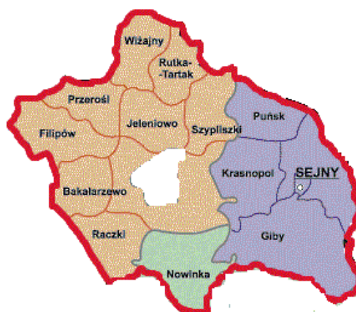
Rys. 2 Obszar „Suwalsko – Sejneńskiej” LGD