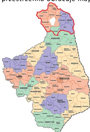
Rys. 1 Obszar „Suwalsko – Sejneńskiej” LGD na tle województwa podlaskiego