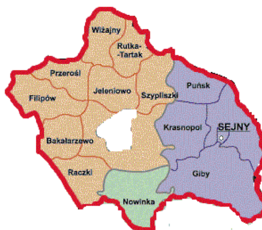
Rys. 2 Obszar „Suwalsko – Sejneńskiej” LGD